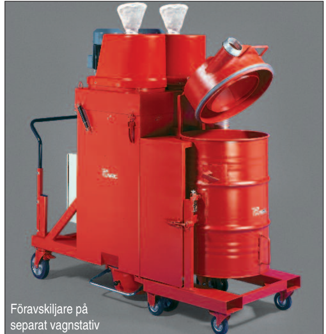
Föravskiljare på separat vagnstativ