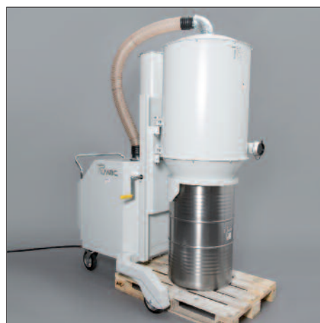
200-liters fat på Europapall