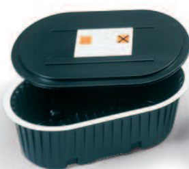
Bortskaffandetråg med lock