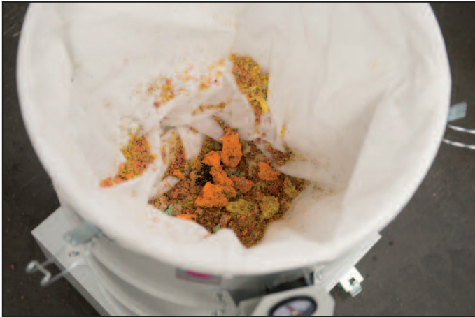
Skärresterna samlas i non-woven-påsen

Industrisugarna i DAV-SB-serien används för uppsugning av såväl tygludd som skärrester (t.ex. papper, plast, tyg) i produktionsanläggningar. Sugeffekt, konstruktion och mått har anpassats till de produktionsmaskiner som de ska användas vid. Skärresterna sugs upp och samlas i en filtersäck med dammclass M. Det uppsugna materialet trycks ihop så att filtrets volym utnyttjas optimalt. När filtret är fullt är det lätt att ta ut ur sugen.