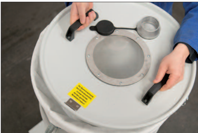
Lyft locket vid filterbyte