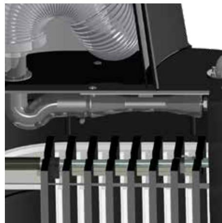
Kraftfullt, robust Venturi-munstycke