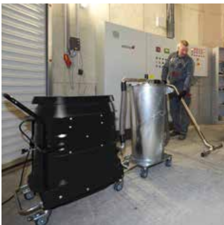
R01 A024 inom industribageri